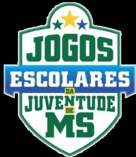
TABELA DE MODALIDADES E DIVISÕES – ESCOLARES 2024